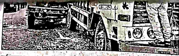
दुर्घटनाग्रस्त ट्रक व हाइवा.