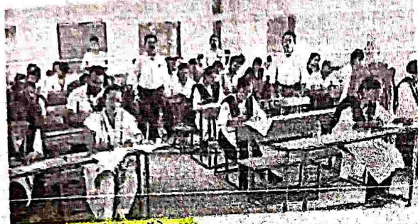
मधुरा सिंह टीचर ट्रेनिंग कॉलेज।

या कि मसूदा नंबर D-85 पर है। मैकेज एवं गृह जन काने के क्रम में लगभग तब बस्ती एवं अन्य रहा है।