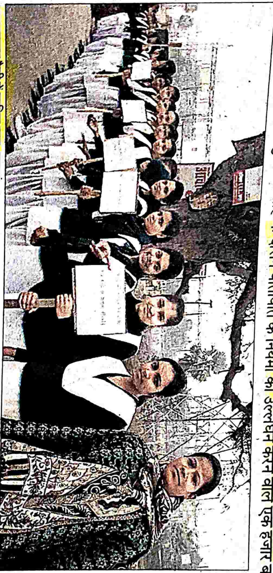
जागरूकता रैली में शामिल छात्र-छात्राएं.

सड़क सुरक्षा सप्ताह के अंतिम दिन रात के पूर्वी इलाके में एएनडी जिला स्कूल (आवासीय), खलपुर, एएनडी हाइस्कूल भिखारी चौक तथा मयुरा सिंह शिक्षक प्रशिक्षण विद्यालय के छात्र-छात्राओं ने जागरूकता रैली निकाली, जिसका