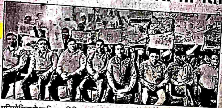
प्रतियोगिता में शामिल अतिथि.